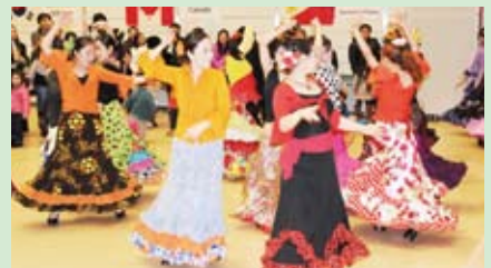
田代フラメンコ教室の皆さん