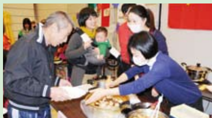
「おいしそうだねえ」