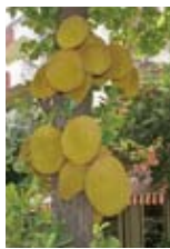
ジャックフルーツ

でも、やはり世界的に有名なセイロン茶が自慢です。紅茶としては世界一の輸出国です。日本のみなさんも多分知っていると思います。買い物で見かけたら、私たちのことを思い出してくれると嬉しいです。