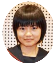
国際ソロプチミスト 御殿場特別賞