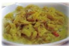
ジャックフルーツの料理

カレー料理も本場ですから、いろいろなスパイスを工夫して食べます。ジャックフルーツという果物をたくさん採り入れた、おいしい料理もあります。