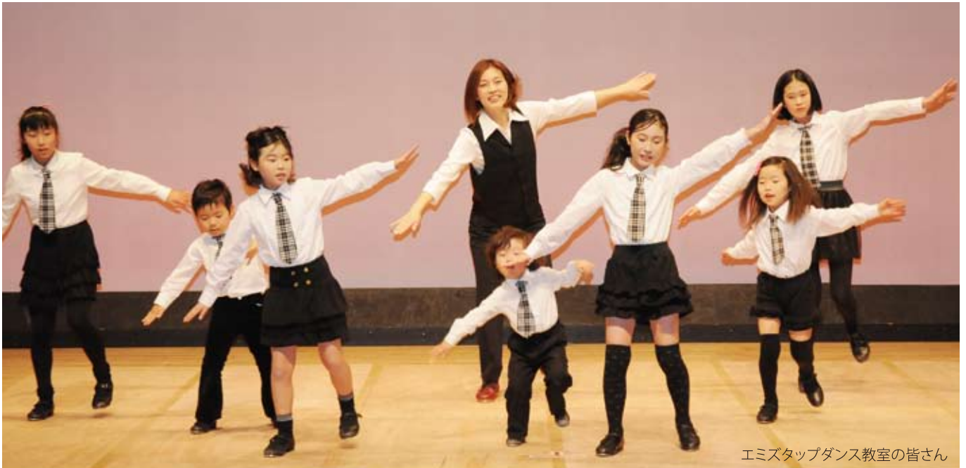
エミスタップダンス教室の皆さん

発行日 平成25年3月21日 発行 御殿場市国際交流協会 御殿場市役所内 TEL.0550-82-4426 編集 広報部会