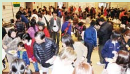
どのブースも大盛況