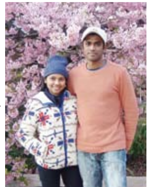
大好きな満開の桜の前で

職場では私たち外国人にも、日本人と同じように平等に対応してくれます。美しい富士山のふもとの町に妻と住み、楽しく仕事をすることができてとても幸せです。