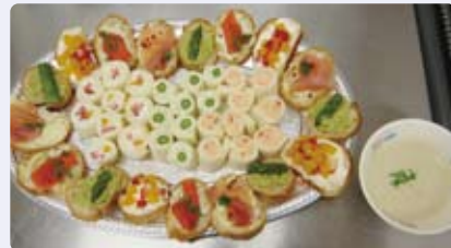
カナッペと一口サイズのロールサンド、ポタージュ