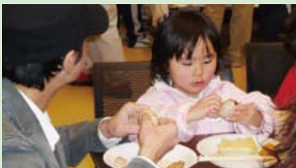
「お茶でゆでた卵、早く食べたいな」