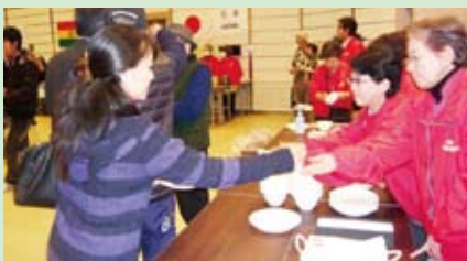
ゴミ削減のため食器はリユースです