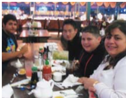
レイチェル家のお母さんや子どもたちと レストランで