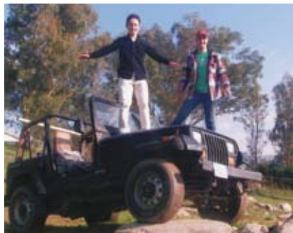
大きなアメリカは気持ちいい! お気に入りの写真です