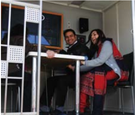
震度7の揺れを体験!

静岡県東部危機管理局による、在住外国人を対象とした防災講座と災害体験を同時開催しました。外国語版防災マップや、アンケートに答えた人には非常食が配布されました。