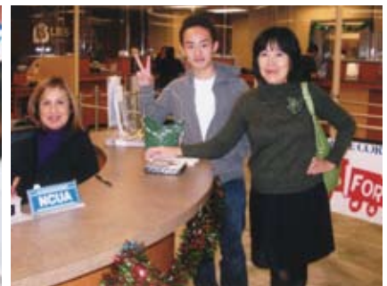
銀行に行き会話をしました とてもフレンドリーに接してくださいました